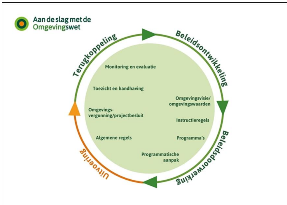
Figuur 1.1 De beleidscyclus