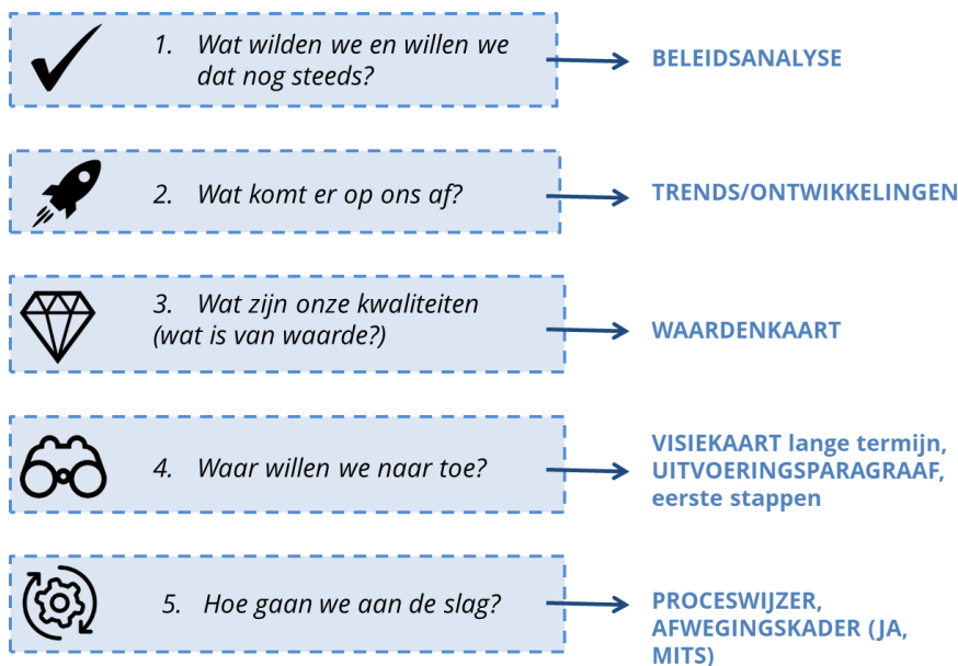
Figuur 1.2 Stappen Omgevingsvisie (bron: BügelHajema Adviseurs)

Na de Kadernota gaan we de opgaven aanscherpen, aanvullen en uitschrijven in een visie en een afwegingskader voor initiatieven. Op basis van de Kadernota en de beleidsinventarisatie maken we een waardenkaart met gebiedswaarden en toetsen deze tijdens de participatie (stap 3). Mede op basis van de inbreng tijdens de participatie worden gebiedsgerichte (kern-)visiekaarten gemaakt die opnieuw voorgelegd worden aan inwoners en stakeholders (stap 4). In hoofdstuk 5 is de aanpak van het vervolgtraject van de Kadernota beschreven.